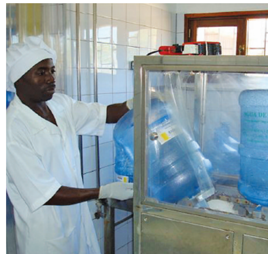
Daglig blir opp mot 300 flasker vasket og fylt opp med vann som har gått gjennom syv filtere og ultrafiolett bestråling.