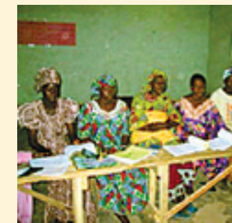
UNDERVISNING: I Niger får voksne kvinner lære å lese, og de får undervisning i søm.

For tiden er det to utviklingsprosjekter. Det er Hausa literacy, Zinder og Training Centre for literacy, Niamey. Begge prosjektene driver leseopplæring blant voksne, primært kvinner. Det undervises også i søm.