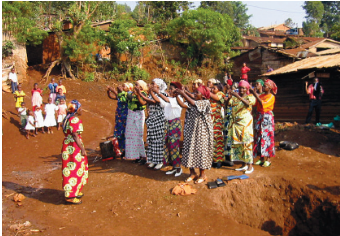
Vilkårene i oppvekst og ekteskap er meget vanskelige for kvinner i Kenya. Når kvinnene står sammen kan de støtte hverandre.

– De fleste tar med seg sin kultur selv om de blir født på nytt. De har ingen annen kultur å ha som forbilde. Enkelte pastorer forkynner at det ikke er riktig å undertrykke kvinner, mens andre siterer ivrig Pauli ord om at mannen er hode og kvinnene skal tie. Generelt sett står kvinner lavt også i menigheten, selv om de nok lider mindre her enn ellers i samfunnet, sier de to. – Ofte rangeres kvinner sammen med barn og dyr.