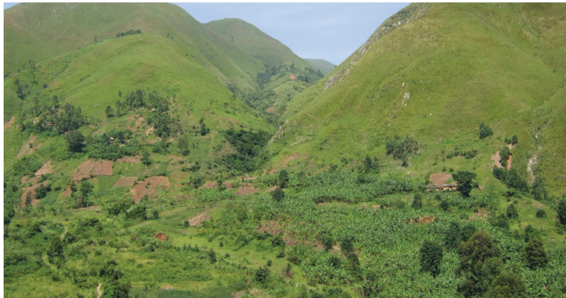
UKONTROLLERT JUNGEL: Med store, ukontrollerte jungelområder i Sør- og Øst-Kivu, er det lett for overgripere å skjule seg mellom hver gang de raider landsbyer.

– For mange av de voldtatte kvinnene er dette en tragedie for resten av livet. Mange blir utstøtt fra familien