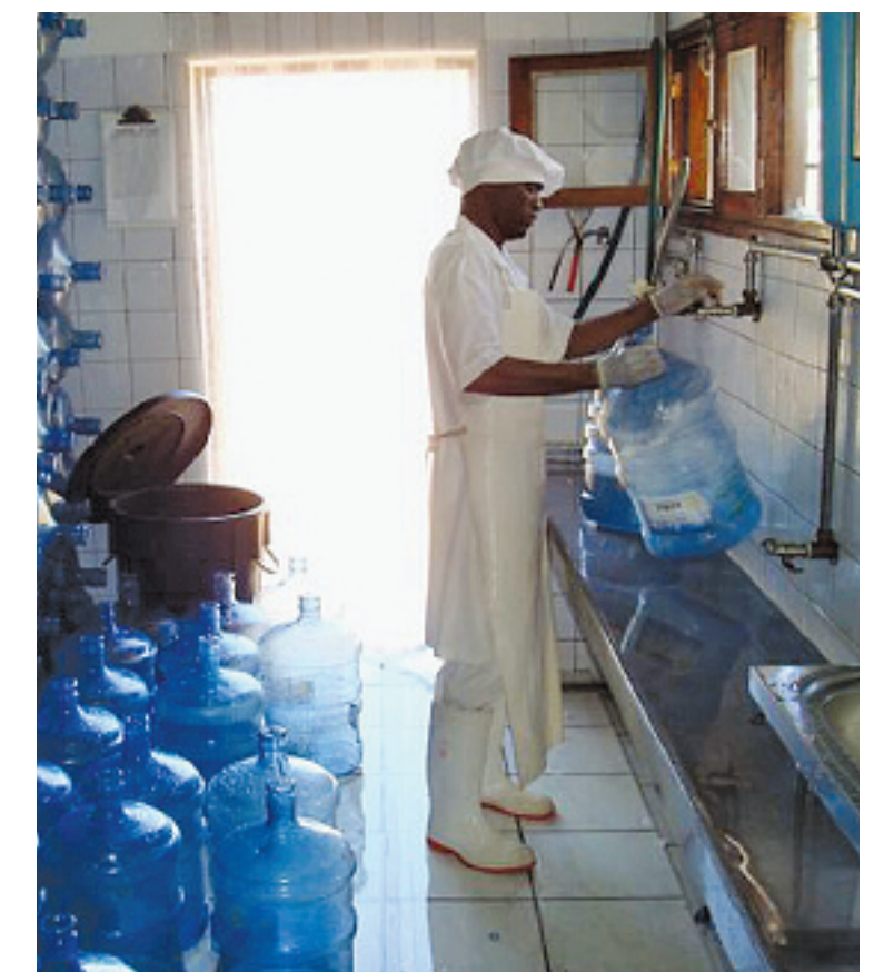
Da de boret etter vann til bruk for gatebarnsenteret oppdaget man en vannkilde. Etter en oppbyggingsperiode av vannfabrikken, finansierer vannsalget i dag driften av senteret.