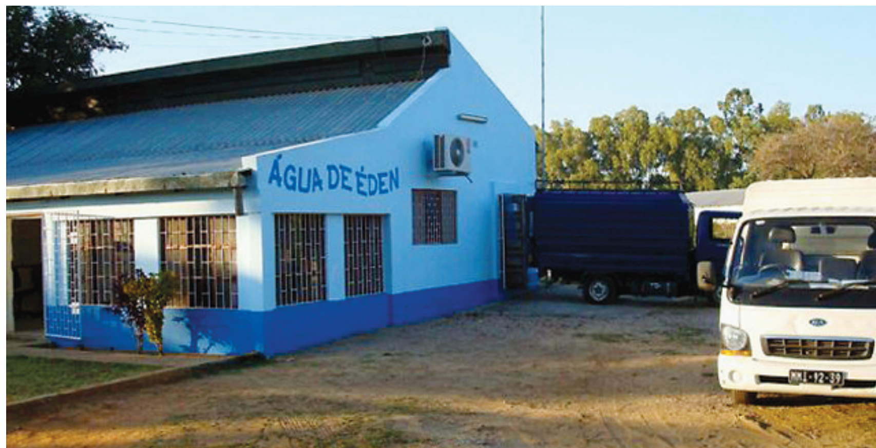
Med 11 ansatte og salg av 84.000 liter vann i varme måneder, er fabrikken Agua de Eden en god inntektskilde som dekker driften av gatebarnsenteret.