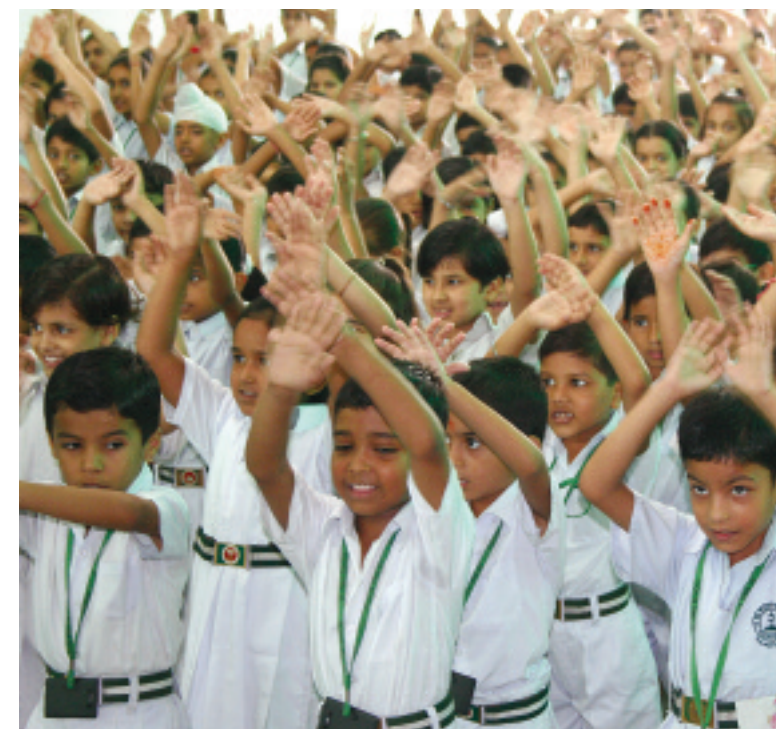
Takknemlige elever vinker til norske lesere.