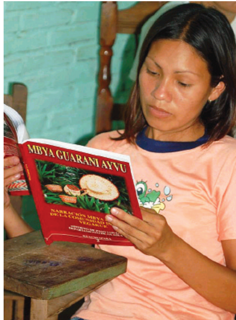
ENDELIG: Etter et vellykket bistandsprosjekt kan denne unge indianerjenta endelig lese om sin egen kultur på sitt eget morsmål.

Dette arbeidet ble kjent blant andre indianerstammer som ønsket tilsvarende tiltak for å ta vare på sin kultur. I 2007 startet arbeidet med lærebøker til mbya-stammen. Dette arbeidet skal gå fram til 2009.