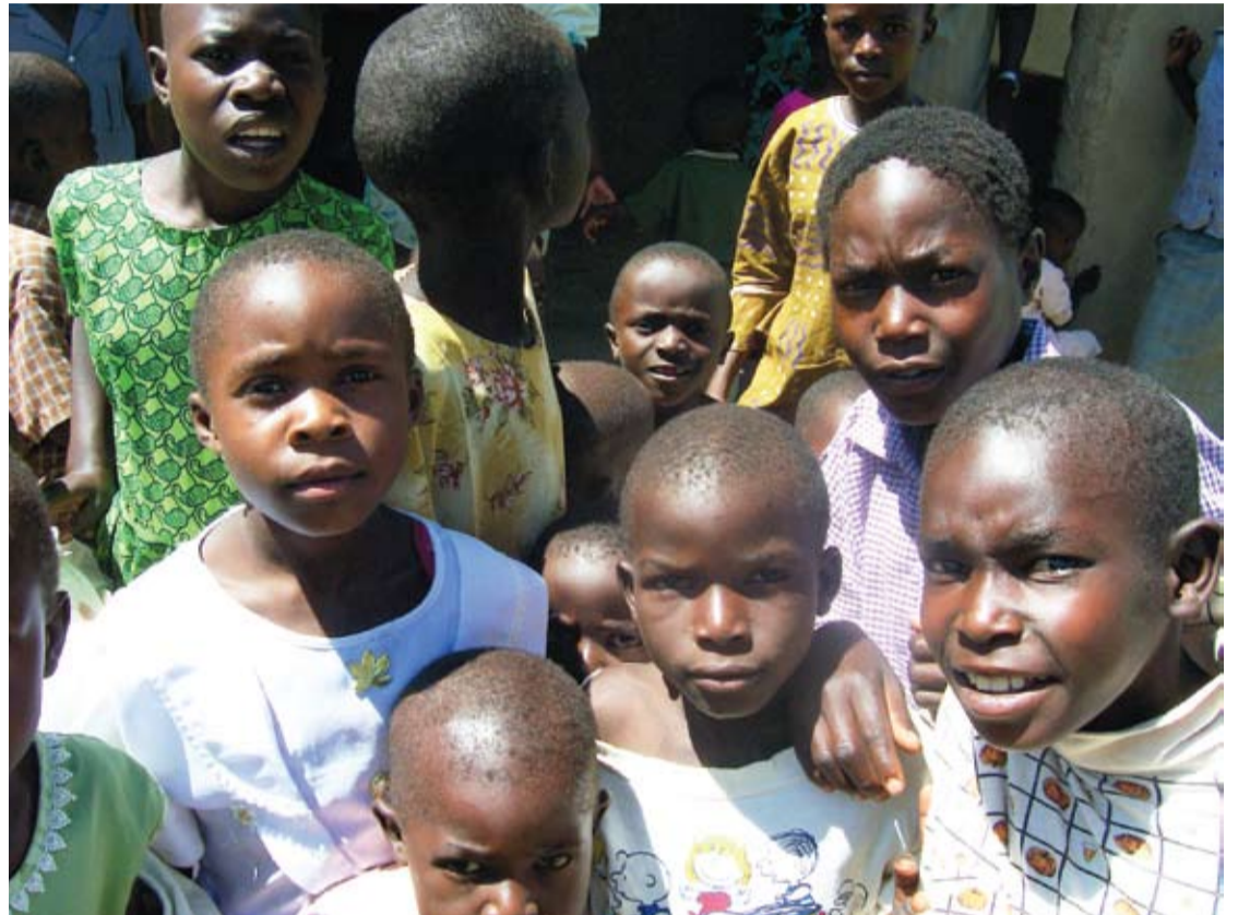
FORELDRELOSE: I de fleste konflikter er det barna som lider mest. Disse barna har én ting til felles – de har mistet sine foreldre.

Mukoya forteller videre at taperne i krigen alltid er kvinner og barn. Som etterlatte etter sine