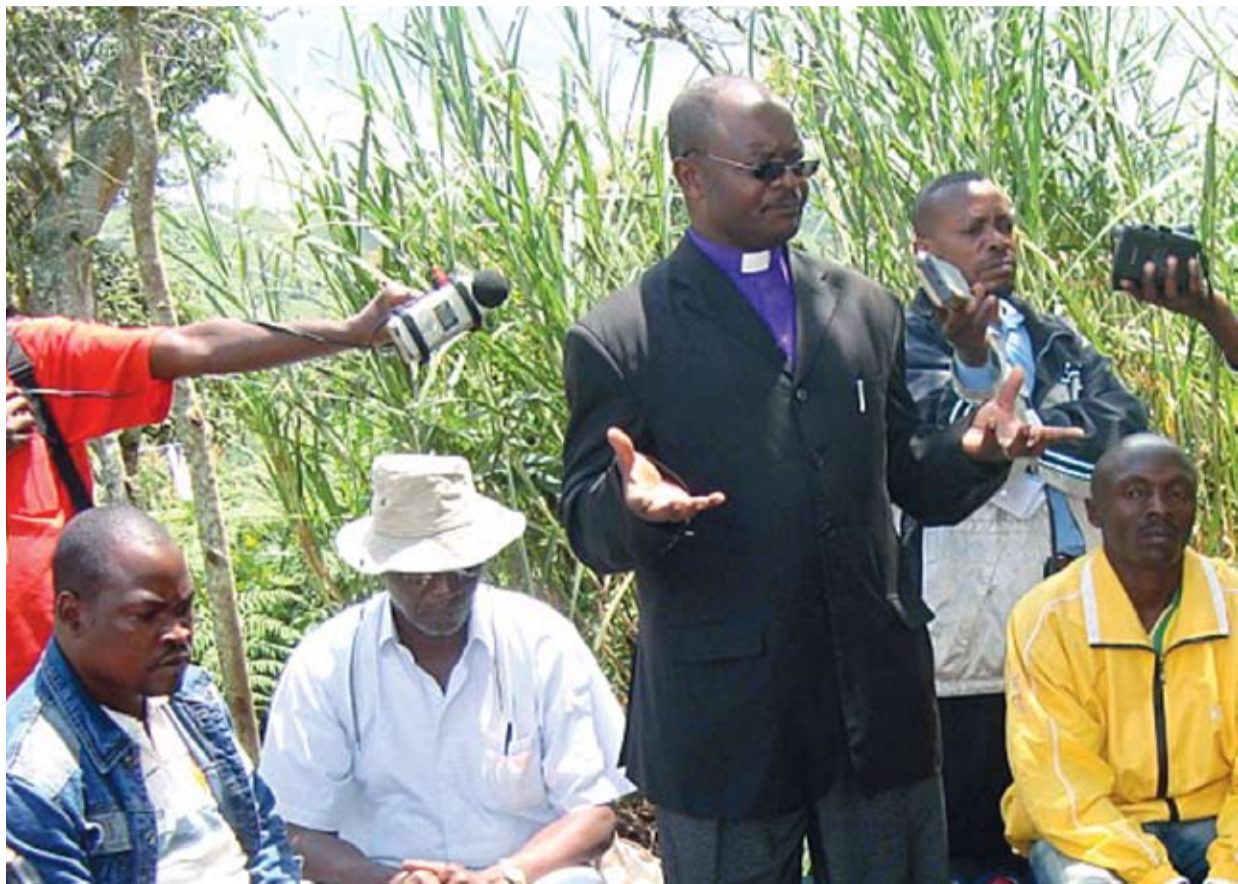
PÅ SOLDATBESØK: Pinsepastor og Raftovinner Lembelembe er en av de få lederne som har tillitt hos rwandiske milittsoldater. Sammen med dem og deres familier bor i leirer i Øst Kongo.

terkulturell Kommunikasjon (SIK) i Stavanger.