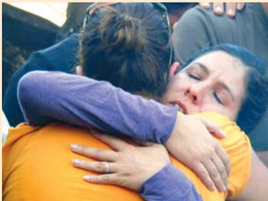
FRED: Samlingene i ørkenen gir anledning til forsoning mellom mennesker fra palestinsk og israelsk side.