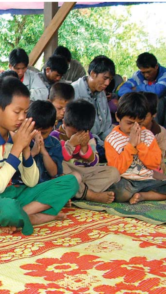
et budskap om kjærlighet og håp. Og at de bare kan oppleve virkelig

– Selv om Shanfolket har opplevd mye undertrykkelse og forfølgelse, er de likevel stolt av å være shan og elsker sitt eget land og kultur. De er veldig snille og gjestfrie. De er også hardt arbeidende og deres situasjon her gjort dem mer åpne for forandring.