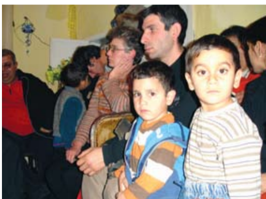
HUSMENIGHET: En husmenighet i Vesenkova, bestående av tyrkere og bulgarere.