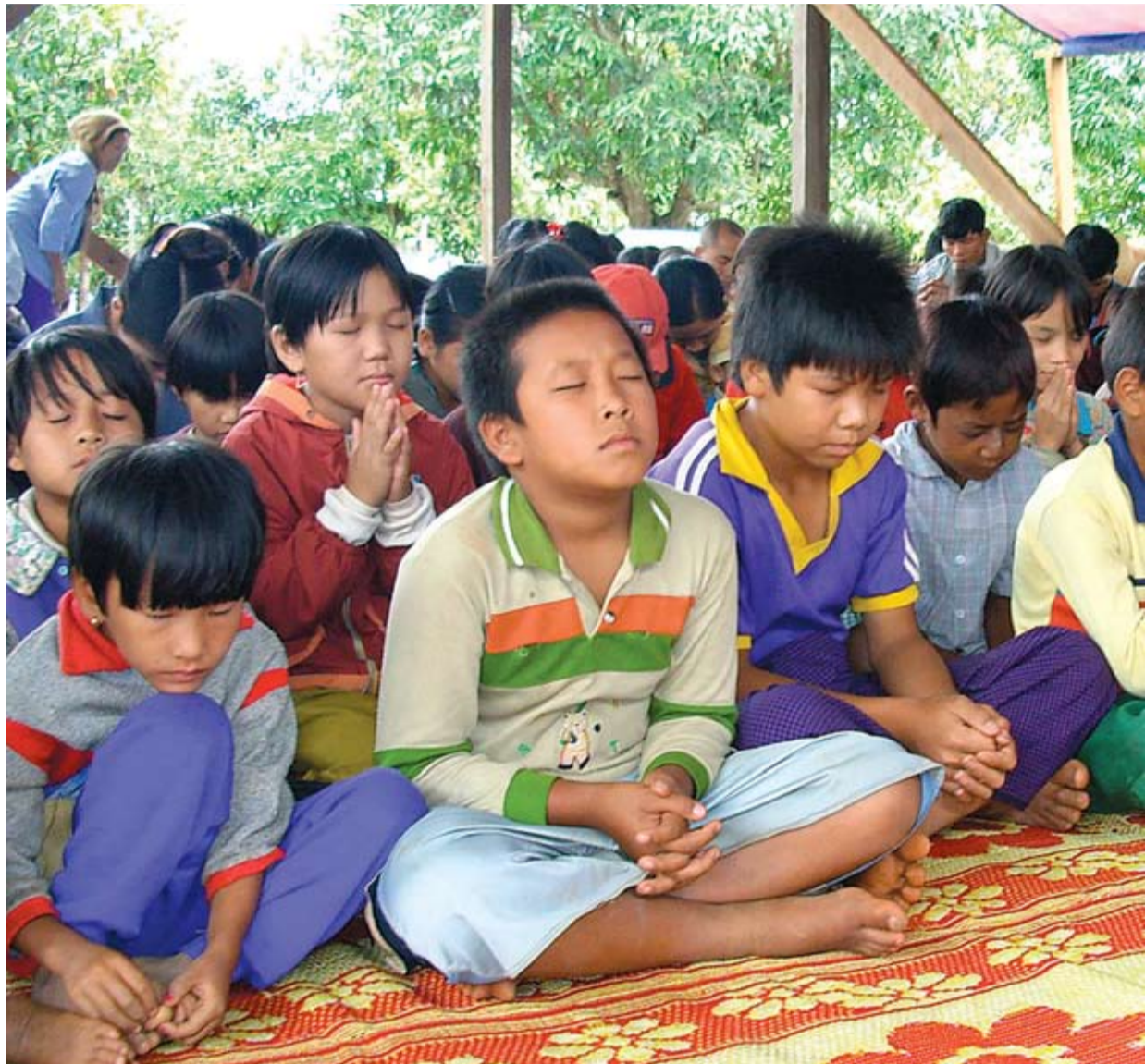
FRED GJENNOM EVANGELIET: Siden Shanfolket har opplevd så mye lidelse og er så splittet blant sitt eget folk, trenger de å høre fred igjennom evangeliet om Jesus Kristus.