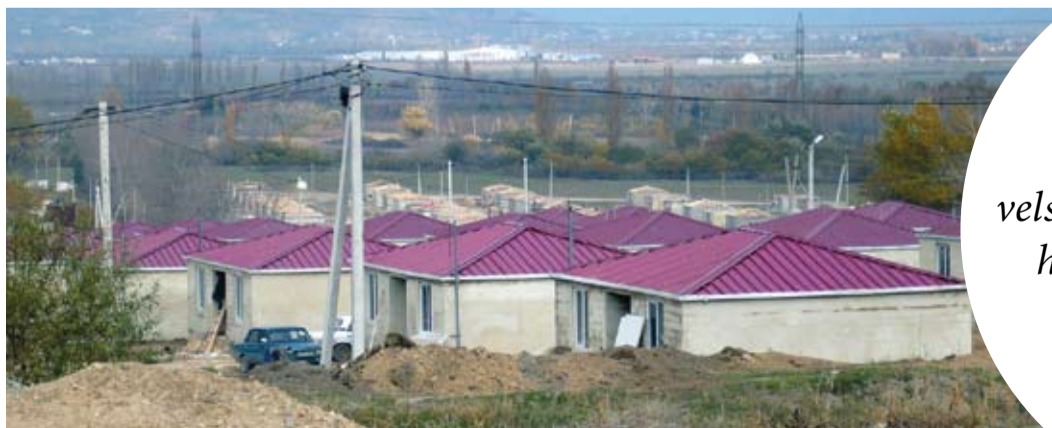
BOSETTINGER: De første flyktningefamiliene har nå fått tildelt bolig i bosettinger omkring Tbilisi.

«Når fokuset blir på Jesus Kristus, og vi som er til stede velsigner framfor å mistenke hverandres hensikter og holdninger, blir vi også velsignet»