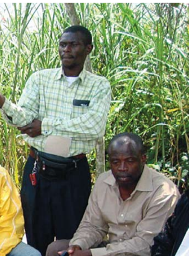
en med kirkenettverket ECC arbeides det for avvæpning og hjemreise til

ing. Det er veldig positivt, noe UD også er enige i og fortsatt ønsker å støtte.