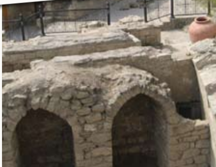
Gamlebyen i Baku, hvor Barnabas angivelig skal ha blitt gravlagt