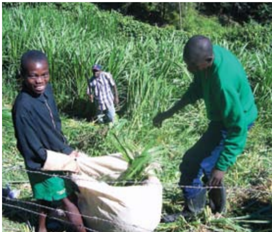
BARNEARBEID: Som i de fleste konflikter er det barna som lider mest. Unge foreldreløse gutter og jenter blir sendt ut på åkrene for å livnære sin familie.

Denne situasjonen , samt det de har vært igjennom av trusler og mord på familiemedlemmer og