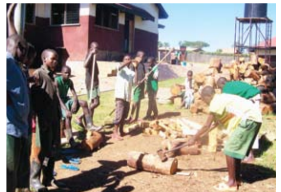
HÅP: En ny generasjon øyner håp gjennom hjelpeprogrammet i Kitale hvor gateguttene får hjelp til å lære seg et håndverk.

Kirkene i området har i mange år hatt en meklende rolle i konflikten, og jobbet aktivt for at de ulike gruppene skal kunne leve sammen i fred. Det er FPFK som har tatt initiativ til prosjektet, som består av tre hovedfelt. Et av de tre områdene er forebyggende samlinger for barn og unge på tvers av etnisk tilhørighet. Dette skal fremme dialog og sameksistens, og gi den oppvoksende generasjonen nye idealer og holdninger. Et annet område er arbeid for fred og konfliktløsning. Her vil lokale politikere og ledere kurses i konflikthåndtering. På grasrota vil det holdes seminarer i menneskerettigheter, urfolksrettigheter og kvinner og barns rettigheter. Det tredje området er opplæring i advocacy, det vil si hvordan de lokale lederne kan nå frem i arbeidet for fred gjennom lobbyvirksomhet og annet organisert arbeid inn mot regionens og landets myndigheter. ■