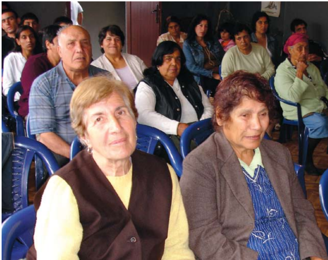
BØNNEGRUPPE: Ei bulgarsk kivenne og to sigøynere, som sammen driver en bønnegruppe som kan vitne om mye bønnesvar.

– Et eksempel er husbesøk i jula, hvor sigøynere går rundt og velsigner familier, og ber for dem. Denne ideen kommer fra en tradisjon som ligner norsk julebukke-tradisjon. Man reiser hjem til venner og kjente, som da byr på en drink. Istedenfor å be om en drink, byr sigøynere på forbønn og