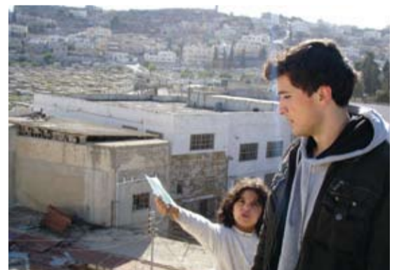
HEBRON: I Hebron har jøder og arabere bodd fredelig sammen frem til den andre verdenskrig. Her en som viser frem byen fra et av de mange hustakene

stripen har flere kristne palestinere mistet livet.