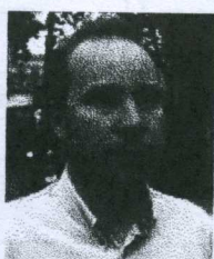
Salemkirken, Oslo Christian Vik