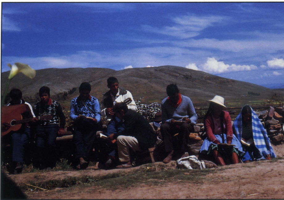
Bolivia. Evangelisk møte i Bolivias høyland.