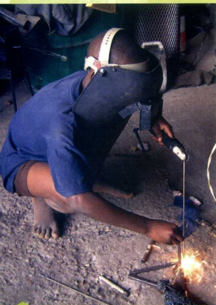
Opplæring i sveisefag ved gatebarnsenteret i Mosambik

PYMs Barnehjelp gir hjelp til barn i nød. Hjelpen gis i hovedsak gjennom samarbeidskirker og misjonærer i mottagerlandene. Barnehjelpen samler inn penger hovedsakelig fra faste givere. Arbeidet er organisert med eget styre og regnskap, men sorterer under PYMs hovedstyre. Kontonr. 7877 08 80679