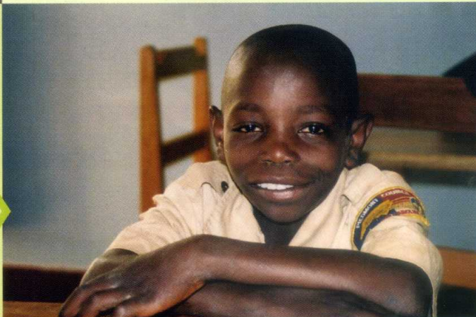
Rehabilitering av barnesoldater i Kongo