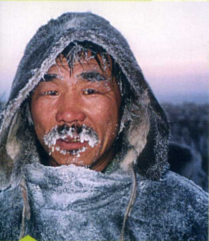
Bønneaksjon for unådde i Sibir

I Afrika og Latin-Amerika har det skjedd store forandringer i misjonsarbeidet. Tiden hvor misjon var en bevegelse fra vestlige land mot den tredje verden, er for lengst forbi. Mange land som har tatt imot vestlige misjonærer, sender nå selv ut misjonærer i stort antall. Dette stiller krav til nytenkning, fleksibilitet og samarbeid. PYM vil være med i denne utviklingen og satser på "partnership in mission".