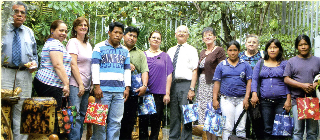
Miembros de la Fundación Prof. Dr. Reinaldo Julián Decoud Larrosa y miembros del Comité becados del Proyecto Kuatiañe'ẽ.

Cada texto presentado contiene la herencia cultural del pueblo ava, mbya y ache guaraní.