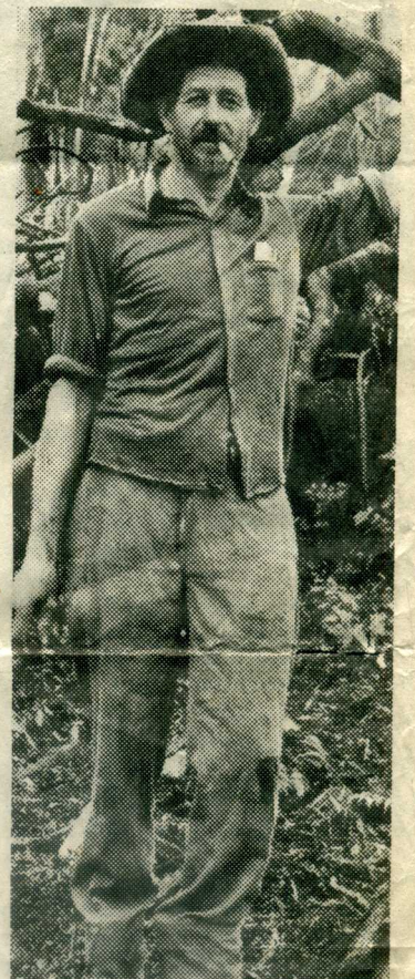
En av de mange tysk-brasilianske kolonistene som i dag kjører opp

I Paraguays Chaco håpet de å finne et varig fristed. Men særlig fristende kan det ikke ha fortonet seg. Til å begynne med vokser gress og palmer langs elva som leder inn i Chaco. Men jo lenger nord man kommer, dess tørrere blir det. Dette er stedet der de høyeste temperaturene i Latin-Amerika er målt. Landskapet er flatt og sandet. Tørre stepper avløses av tett tornekratt og småtrær. Like fullt er der et yrende dyre- og fugleliv, til og med struts finnes her.