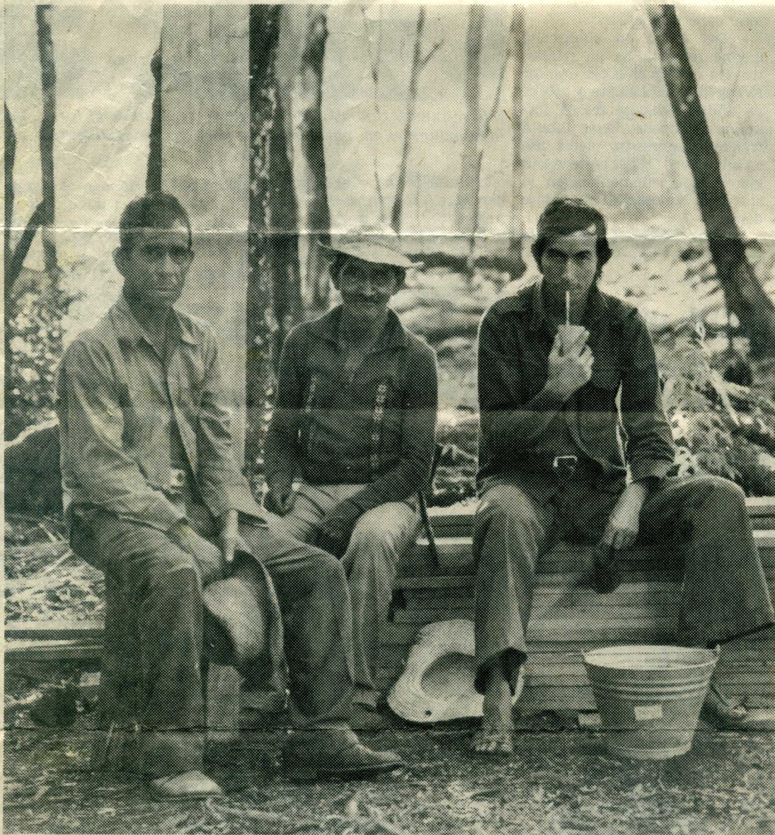
De paraguayanske småbøndene har ingenting å stille opp med i konkurransen med innflytterne. Mange ender pp med å arbeide for dem, i skogen, eller på daglønn under innhøstingen.