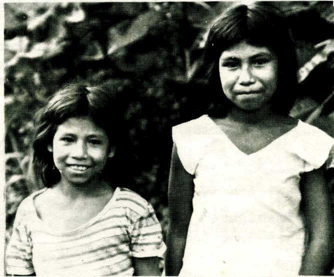
Barn av troende familie.... side 3