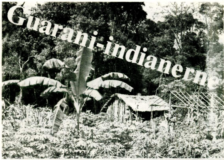
og hans landsby. En vanlig bolig.