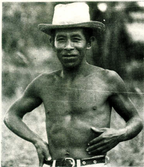
Juelian-en av de kristne. d