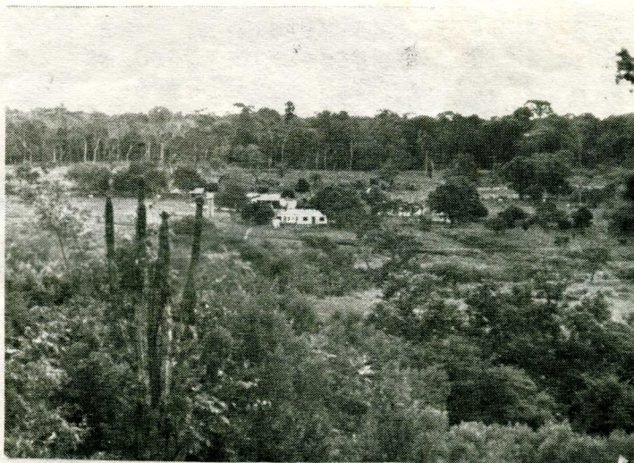
Misjonsstasjonen sett fra "kolonien".