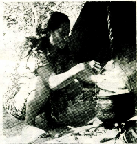
"Gryta hennar mor" er like aktuell her som andre steder. Det er mandioka som kokes...