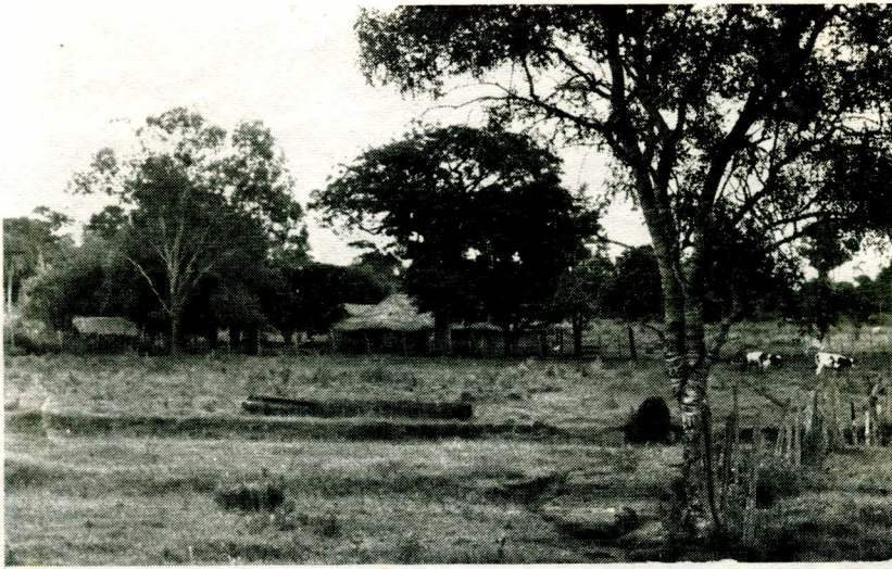
Vår nærmeste nabo. Mannen i huset var tidligere en troende...