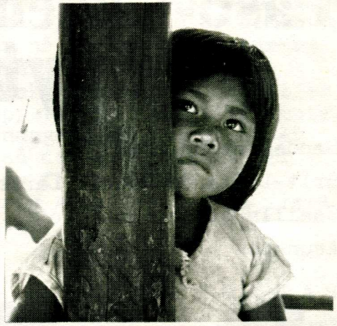
En undrende indianerpике.