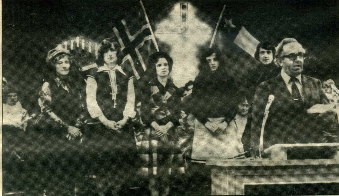
Nye misjonskandidater til Sør-Amerika som reiser ut så snart deres underhold er ordnet.