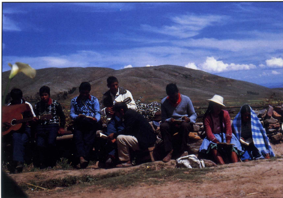
Bolivia. Evangelisk møte i Bolivias høyland.